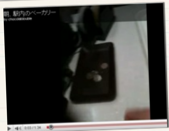
朝、駅内のベーカリー