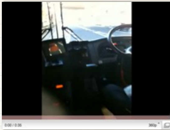
シャトルで現場に到着。