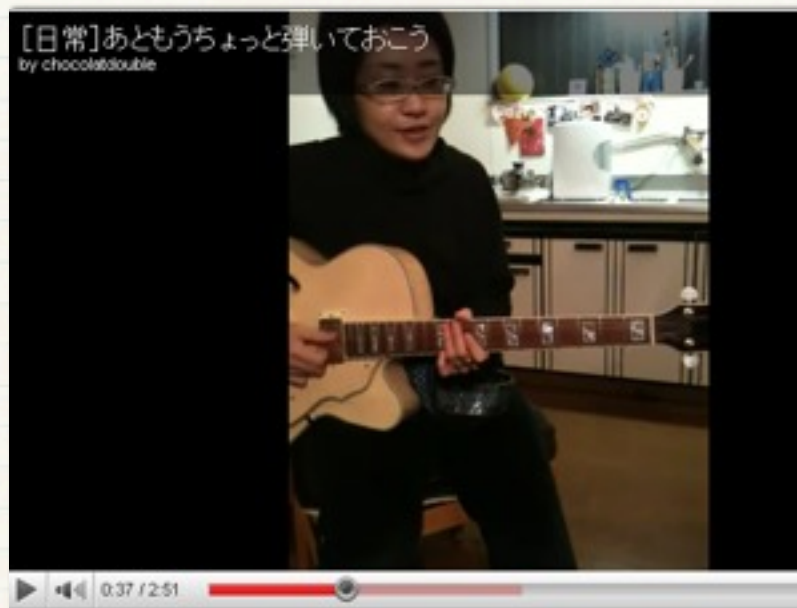
あともうちょっと弾いておこう