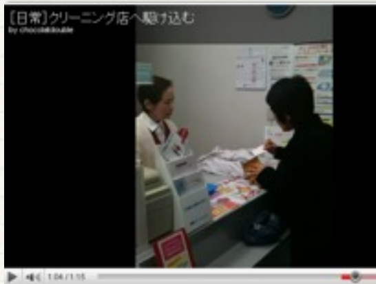
クリーニング店へ駆け込む