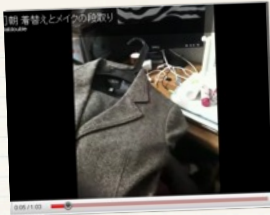
朝 着替えとメイクの段取り